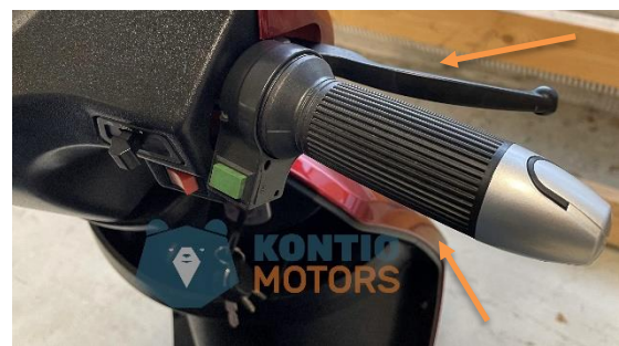
Oikea jarruvipu ja nopeudensäädin